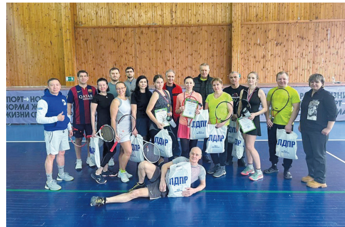
Салехард – соревнования по большому теннису