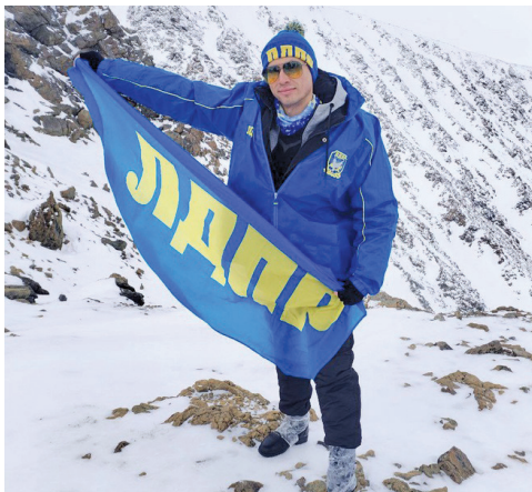
Восхождение на гору Рай-Из