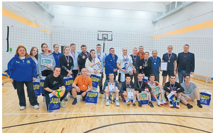
Надым – соревнования по волейболу